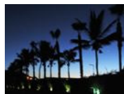
Viajar en México Elige aquí tu próximo destino