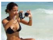
Cámaras para playa Las más resistentes