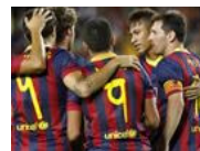
Futbol de peso Los 10 equipos más valiosos