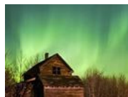
Energía positiva Lléname de ella