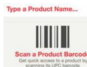
Apps de belleza La tecnología juega a tu favor