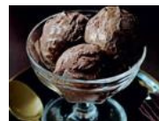
Prepara tus helados Las recetas más deliciosas